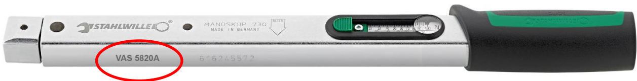
Figura 1 – Posizione della marchiatura VAS/VAG

2) Il numero di serie indicato sul tubo (figura2) ha come seconda e terza cifra i numeri 17 o 18 (alcuni esempi in figura 3)