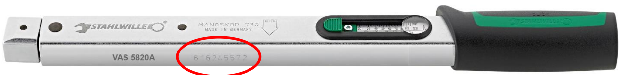
Figura 2 - Posizione del numero di serie

2) Il numero di serie indicato sul tubo (figura2) ha come seconda e terza cifra i numeri 17 o 18 (alcuni esempi in figura 3)