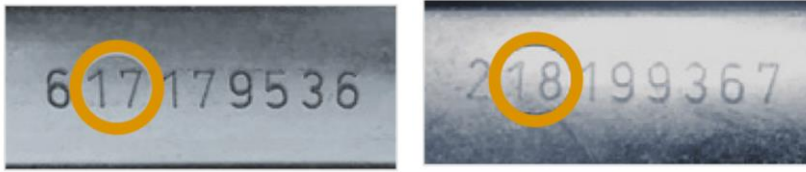
Figura 3 – identificazione della seconda e terza cifra del numero di serie